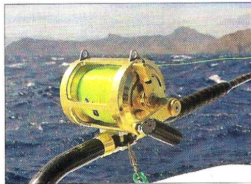
Moulinets et cannes Alutechnos n'attendent plus que la visite des marlins...